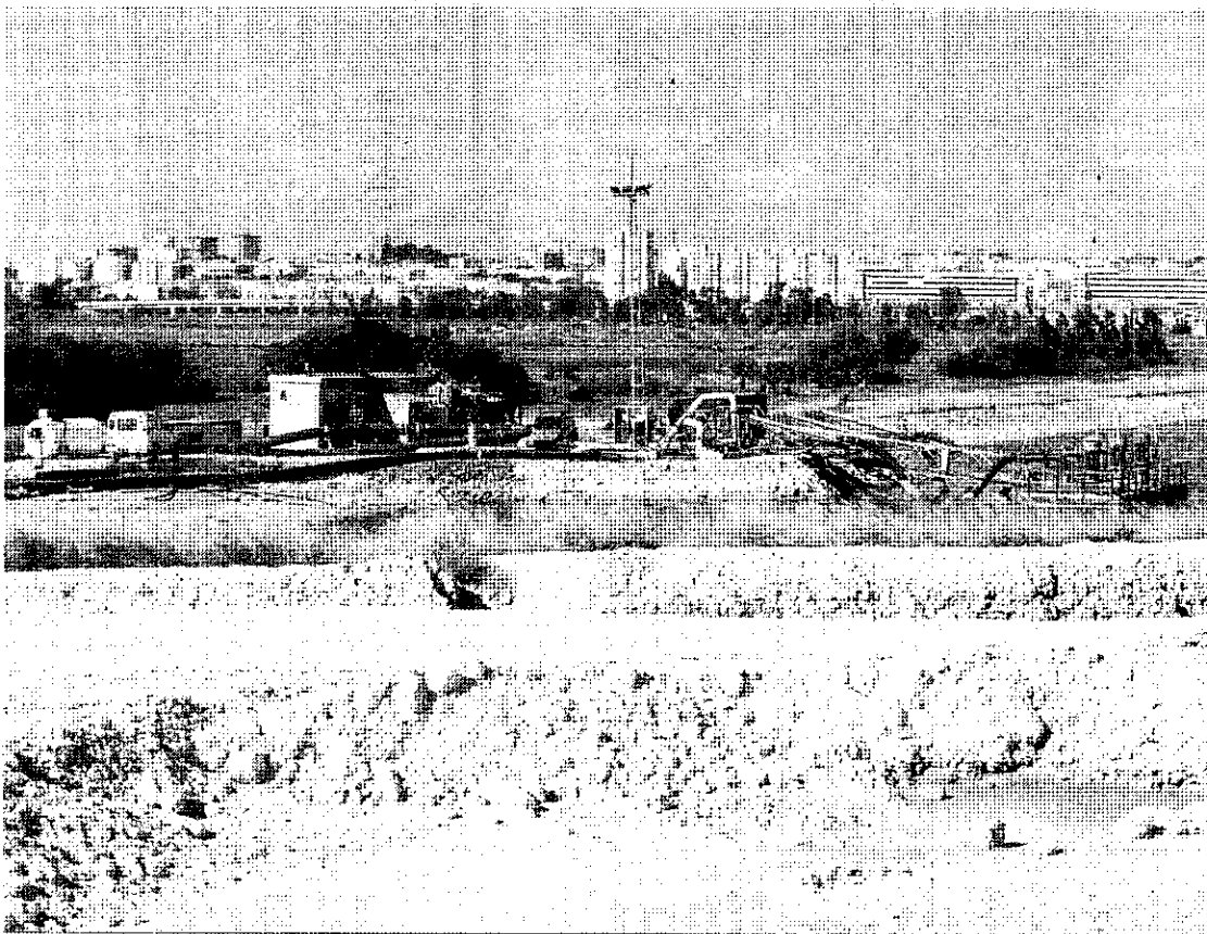
Balsas de fosfoyesos en las marismas de Mendaña.

La Comisión Europea inició ayer un procedimiento de infracción contra España por incumplir las normas comunitarias sobre tratamiento y eliminación de residuos industriales. El Ejecutivo comunitario envió una carta de emplazamiento en la que solicita a las autoridades españolas que faciliten detalles sobre el depósito de residuos sólidos industriales en el estuario de Huelva ante la sospecha de que no aplica las medidas de gestión de